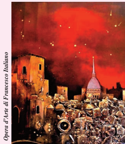
Opera d'Arte di Francesco Italiano