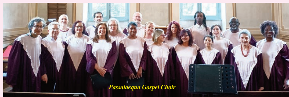
Passalacqua Gospel Choir

Canti Tradizionali Africani, Spiritual e Gospel