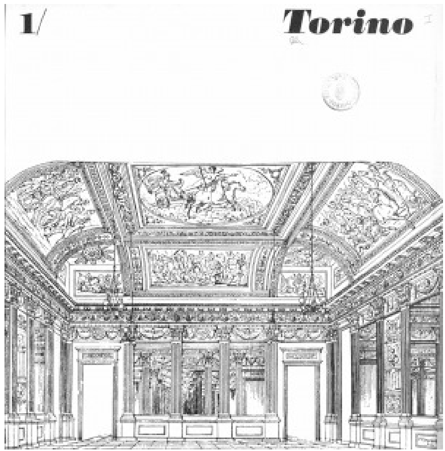
Rivista «Torino», 1969, n.1.