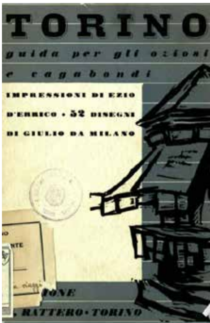
D'Errico, Ezio, Torino: guida per gli oziosi e vagabondi , Lorenzo Rattero, Torino 1936.

549 titoli presenti nella Biblioteca Digitale di MuseoTorino costituiscono un risultato apprezzabile in sé, ancor più significativo se letto alla luce del sistema di relazioni che l'hanno reso possibile e delle prospettive che, a partire da esso, si aprono nel prossimo futuro.