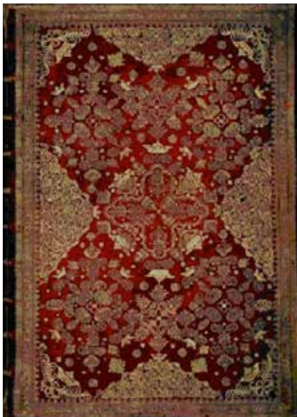
Blaeu, Joan, Theatrum statuum regiae celsitudinis Sabaudiae ducis, Pedemontii principis, Cypri regis. Pars prima, exhibens Pedemontium, et in eo Augusta Taurinorum, & loca viciniora , vol. 1, apud heredes Ioannis Blaeu, Amstelodami 1682.