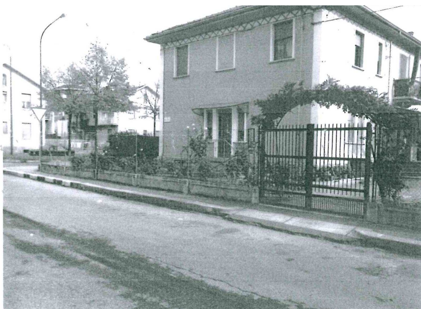
Via Vallarsa 19