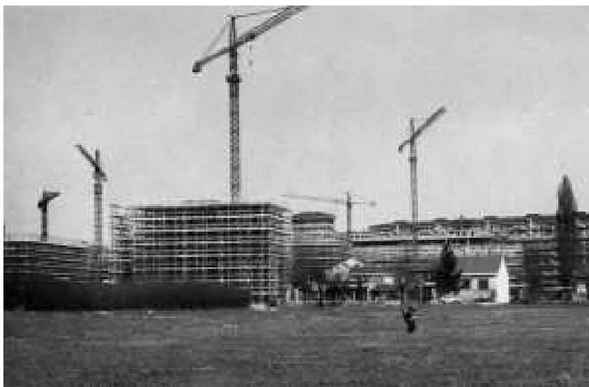
Il quartiere Mirafiori sud in costruzione