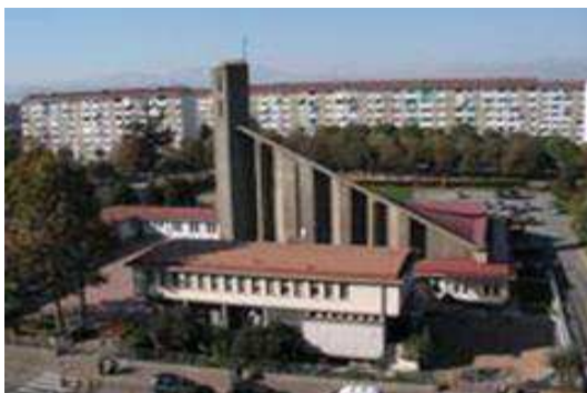
La chiesa di San Luca