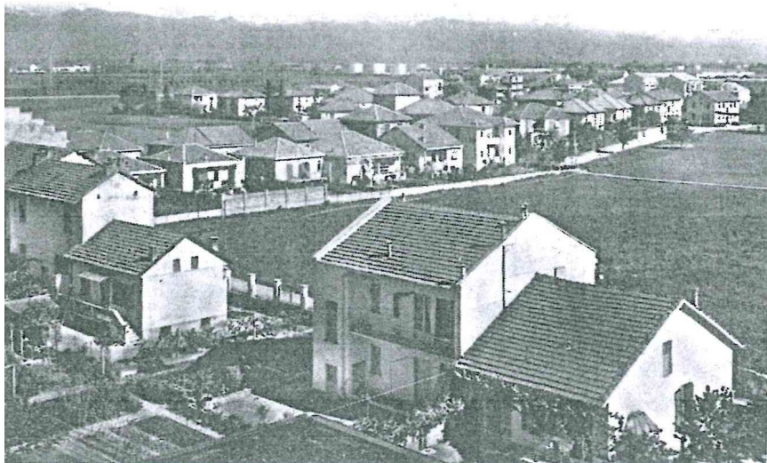
Città Giardino negli anni '50