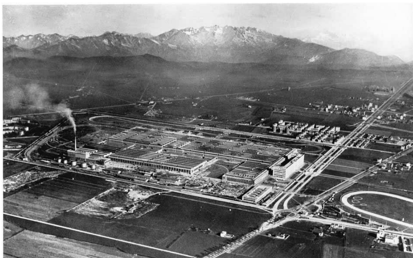
Lo stabilimento FIAT all'epoca della sua costruzione